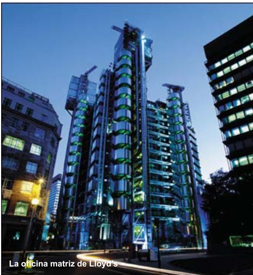
La oficina matriz de Lloyd's